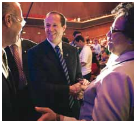
Allocution de Nir Barkat, Maire de Jérusalem

« Année après année, vous venez d'une centaine de nations pour défiler dans les rues de Jérusalem, rappelant ainsi au peuple d'Israël qu'il n'est pas seul. Vous nous rappelez qu'il existe des gens dans le monde qui reconnaissent qu'en retournant à Sion, le peuple juif est rentré chez lui... Cette terre est notre patrie. C'est sur cette terre que les patriarches juifs ont prié, que nos prophètes ont prêché et que nos rois