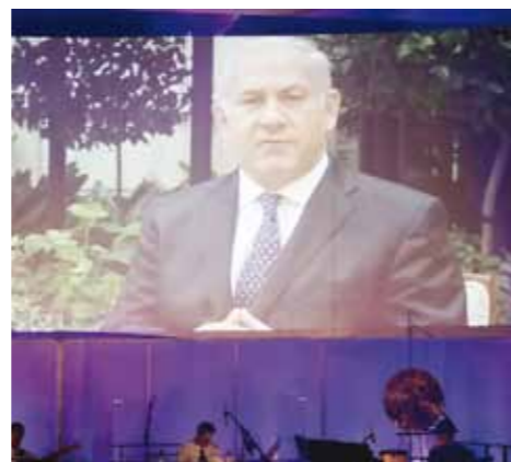
Discours d'accueil du Premier ministre, Benjamin Netanyahu

Le conflit lié à Jérusalem étant une fois de plus à la une de l'actualité, la Fête de cette année a tenu à réaffirmer le soutien du monde chrétien à une Jérusalem unifiée sous souveraineté