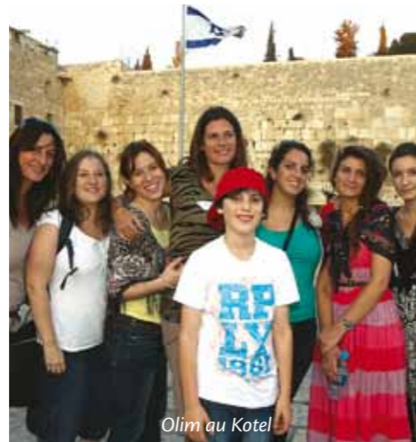
Olim au Kotel