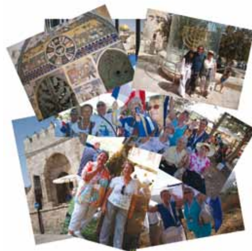
Souvenirs du voyage de Soucoth avec « Le désert refleurit »